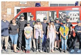
Die Jugendfeuerwehr Groß Ilsede mit den neuen Mützen.

BRAUNSCHWEIG Kinderärztlicher Bereitschaftsdienst im Klinikum Tel. 116117, Salzdzahlunger Str. 90; 16-20 Uhr