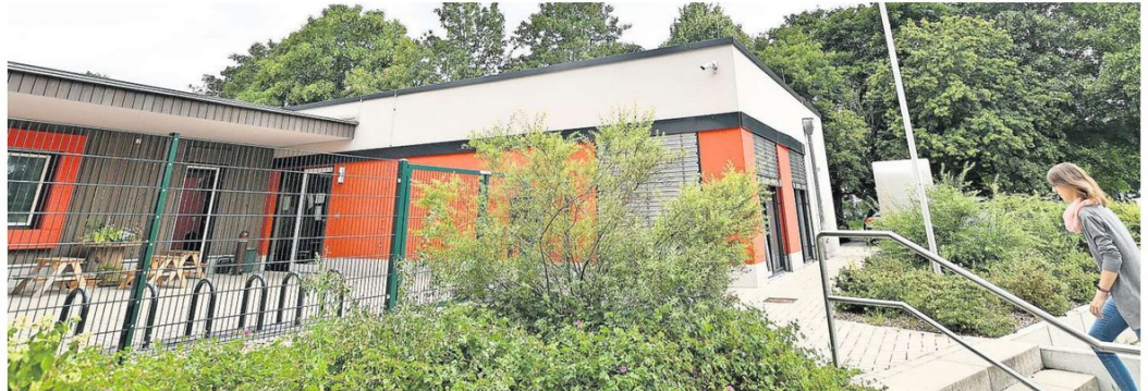
Kita „Kleiner Hobbit“ in Abbensen: Auf dem Gebäude soll eine Photovoltaik-Anlage installiert werden. Noch konnte keine Firma mit den Arbeiten beauftragt werden.